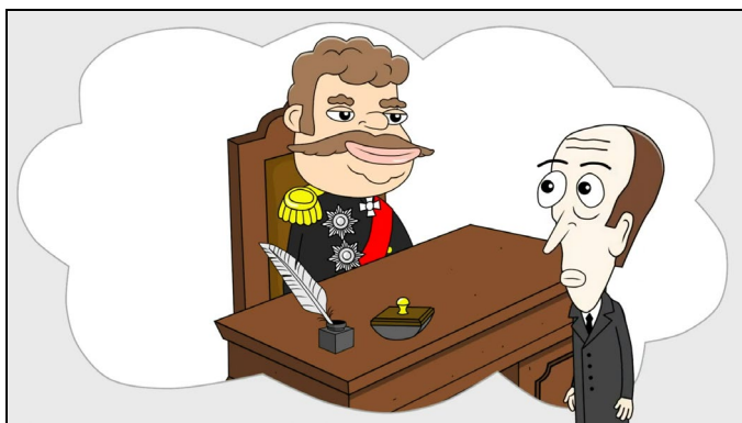
Рисунок 3. Кадр из мультфильма.