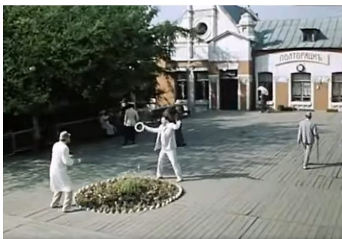
Рисунок 6. Кадр из фильма «Странные люди». Режиссер Михаил Швейцер.